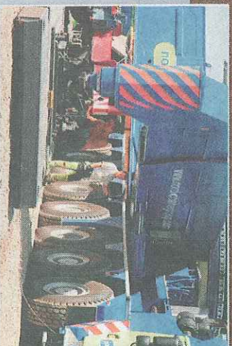
Nordic Crane Winds största maskin är en Liebherr LG 1750, en åttaaxlad värsting som lyfter hela 750 ton. Ovan i aktion vid ett jobb för tyska Enercon i Eslöv, där fyra vindkraftverk monterades under åtta veckor. Tyngsta lyftet var på ca 62 ton och tornhöjden 78 meter.